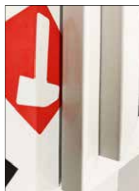
Add-On PREMIUM S

Resultat: Tjuven kommer inte in och inbrottsförsöket misslyckas.