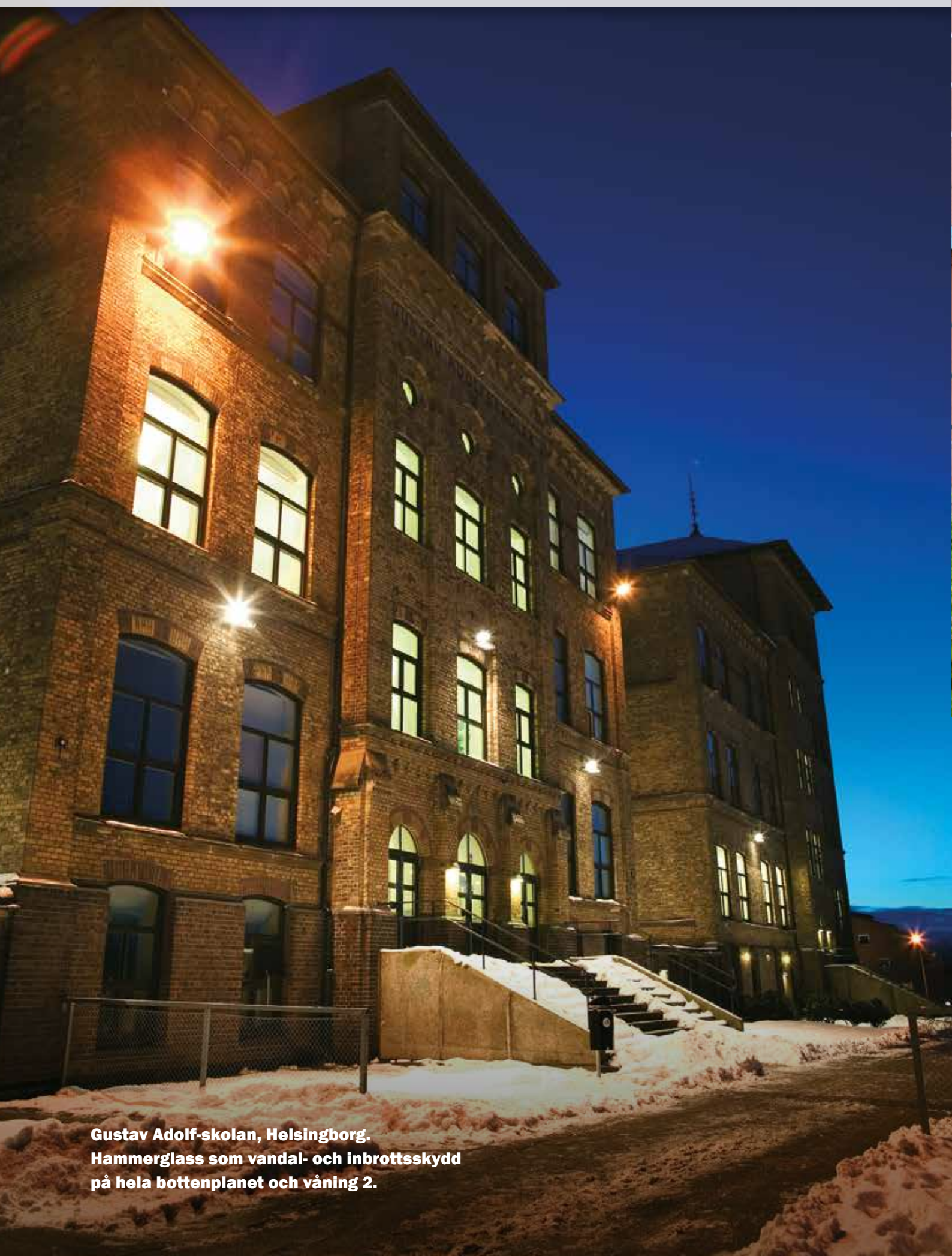
Gustav Adolf-skolan, Helsingborg. Hammerglass som vandal- och inbrottskydd på hela bottenplanet och våning 2.