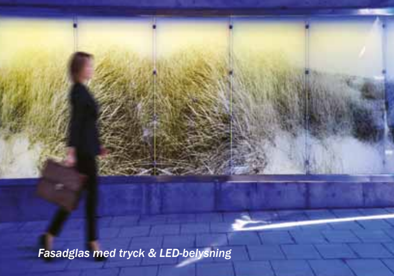
Fasadglas med tryck & LED-belysning