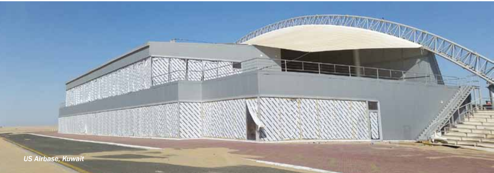
US Airbase, Kuwait