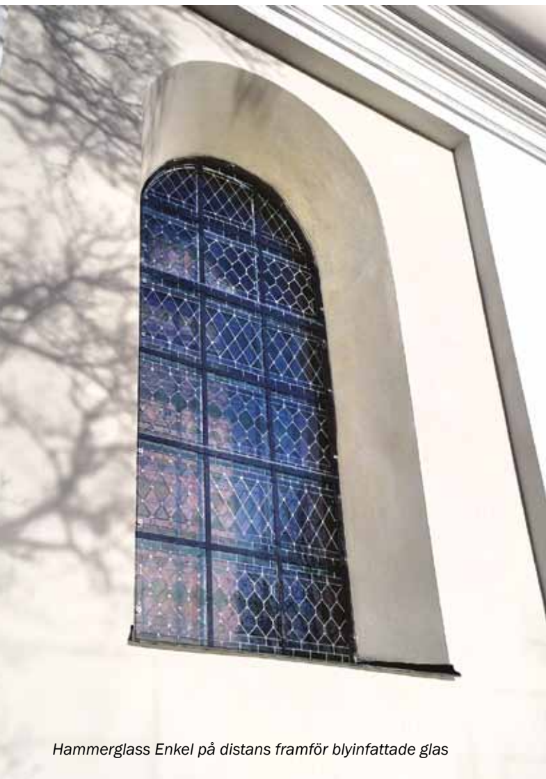
Hammerglass Enkel på distans framför blyinfattade glas