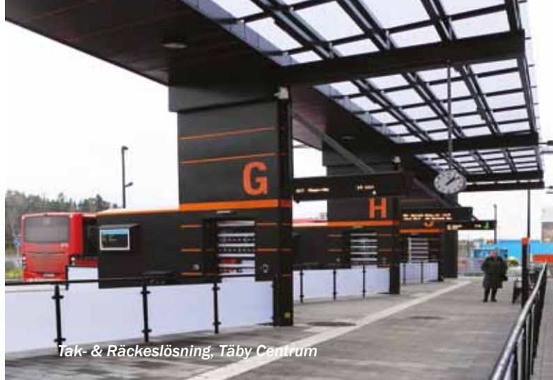
Tak- & Räckeslösning, Täby Centrum