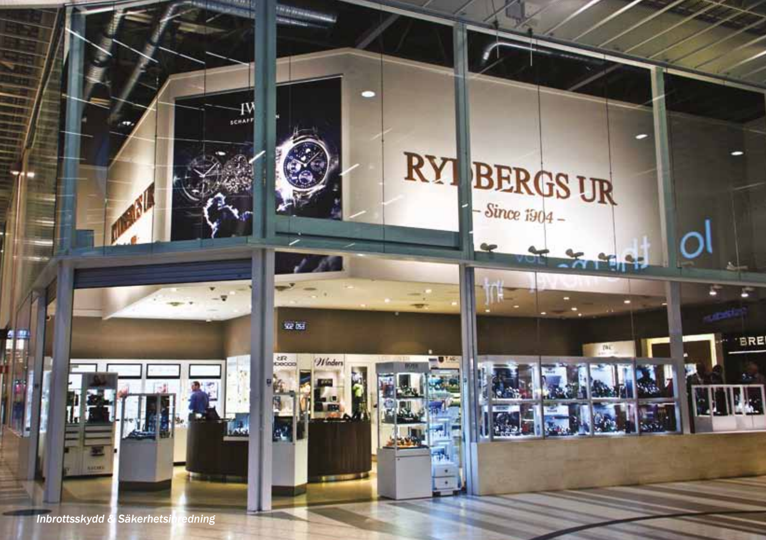
Inbrottsskydd & Säkerhetsinredning