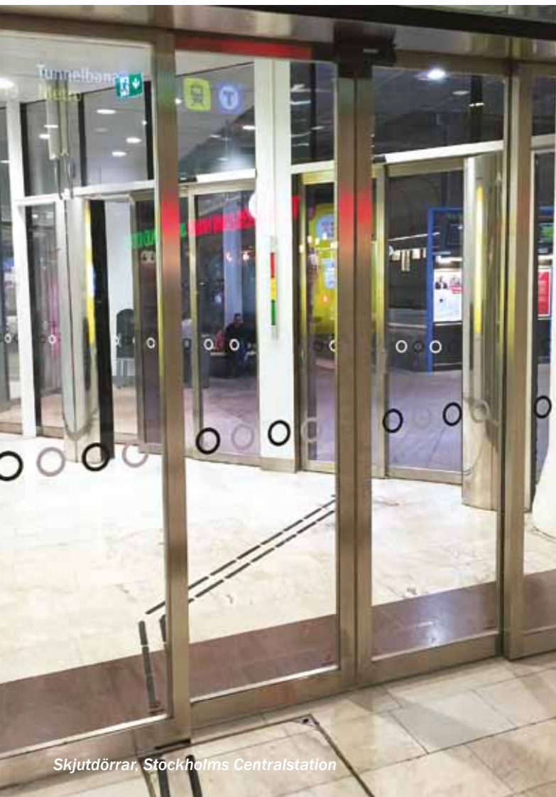
Skjutdörrar, Stockholms Centralstation