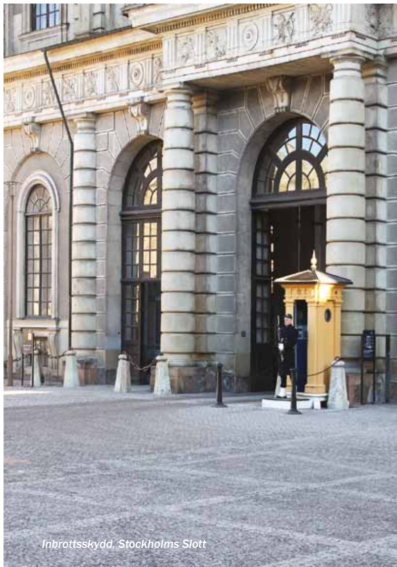
Inbrottsskydd, Stockholms Slott